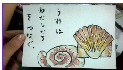
← 絵手紙を書きました