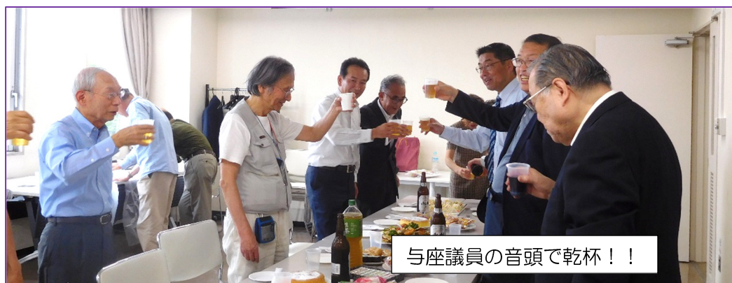
与座議員の音頭で乾杯！！